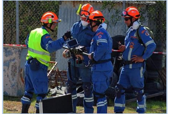
ΑΦΙΕΡΩΜΑ ΣΤΗΝ ΑΣΚΗΣΗ ΕΓΚΕΛΑΔΟΣ 2017 ΤΗΣ ΠΑ: ΤΟ ΧΡΟΝΙΚΟ ΕΝΟΣ ΠΡΟΑΝΑΓΓΕΛΕΝΤΟΣ ΣΕΙΣΜΟΥ